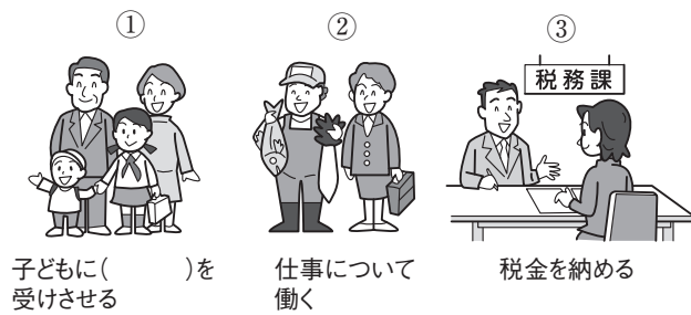
① 子どもに( )を受けさせる